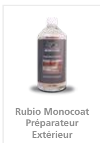
Rubio Monocoat Préparateur Extérieur

Consultez l'emballage et la fiche de sécurité pour plus de détails.