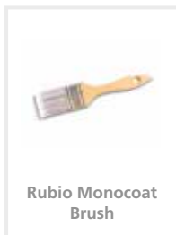
Rubio Monocoat Brush