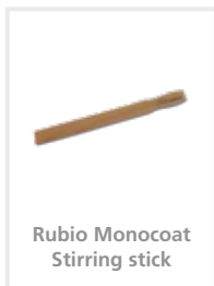
Rubio Monocoat Stirring stick

Nettoyer les outils à l'eau après l'application.